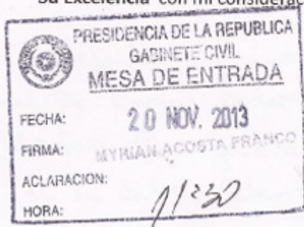
Elisa C. Godoy A. de Gulino Arquitecta

Esperando se de curso favorable a esta propuesta, cumpro al saludar a Su Excelencia con mi consideración más distinguida,